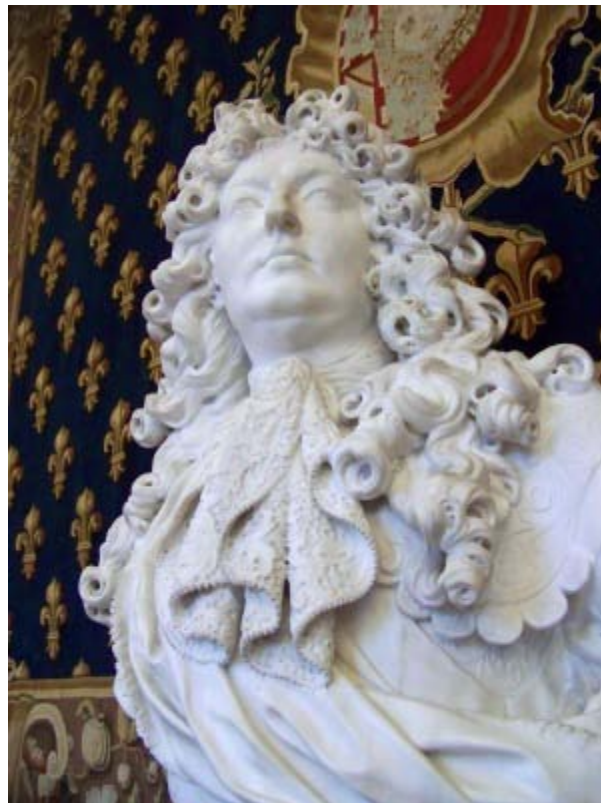
Photo: Superbe buste de Louis XIV

Pour en saisir toute la portée, voici l'exposé que l'on retrouve en page d'accueil de la coordination : http://coordination-defense-de-versailles.info/index.html